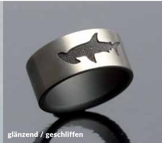
glänzend / geschliffen