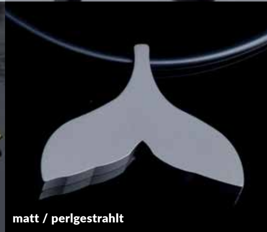
matt / perlgestrahlt

Alle Produkte werden aus Rein-Titan hergestellt. Titan ist leicht , sehr robust , absolut allergiefrei , angenehm zu tragen und gibt den Produkten eine besondere, technische Note. Durch unterschiedliche Arbeitsmethoden können die Schmuckstücke ein-, zwei- oder mehrteilig sein. Durch die Bearbeitung und spezielle Beschichtung der Oberflächen sind viele Kontrastvariationen möglich, welche ein edles und sportliches Aussehen garantieren. Titan ist absolut korrosionsbeständig. Der Schmuck kann somit immer getragen werden (auch während Salzwasser-Tauchgängen) und braucht keine besondere Pflege.