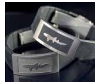
Retro / Retro innen schwarz

Der Verschluss (Faltschliesse) ist aus hochwertigem Edelstahl.